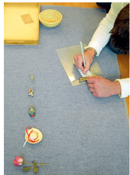
2 | Lesenlernen mit dem „Lesekörbchen“: Zu welchem Gegenstand passt diese Wortkarte?

Um Kindern das passende Material anzubieten, damit sie sich auf das Abenteuer Lesen einlassen wollen, gilt es, den Entwicklungsstand der Wahrnehmung mitzudenken. Dazu zählt allem voran die Schriftgröße, die für Kinderhaus-Kinder zu Beginn bei 70 Punkt liegen sollte. Sie brauchen für jedes zu lesende Wort ein eigenes Kärtchen, das sie in die Hand nehmen können. Dasselbe gilt übrigens auch noch für Leseanfänger(innen) im Schulalter – hier sollte die Schriftgröße anfäng-