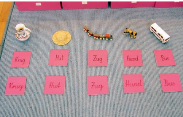
3 | Einsilbige Wörter aus dem rosa-blauen Erstlesematerial

Nach der Einführung der ersten Phonogramme, das sind Buchstabenverbindungen, die als ein Laut gesprochen werden, wie z.B. sch , ch , au , ei , können wir das Lesematerial auf nicht mehr phonetisch geschriebene Wörter erweitern. Dieser Moment trifft meist mit dem Entwicklungsschritt vom handlungsorientierten Lesen, bei dem der Inhalt noch Nebensache ist, zum zielorientierten Lesen, bei dem Lesen als Mittel zum Erfassen des Inhalts bedeutsam wird, zusammen.