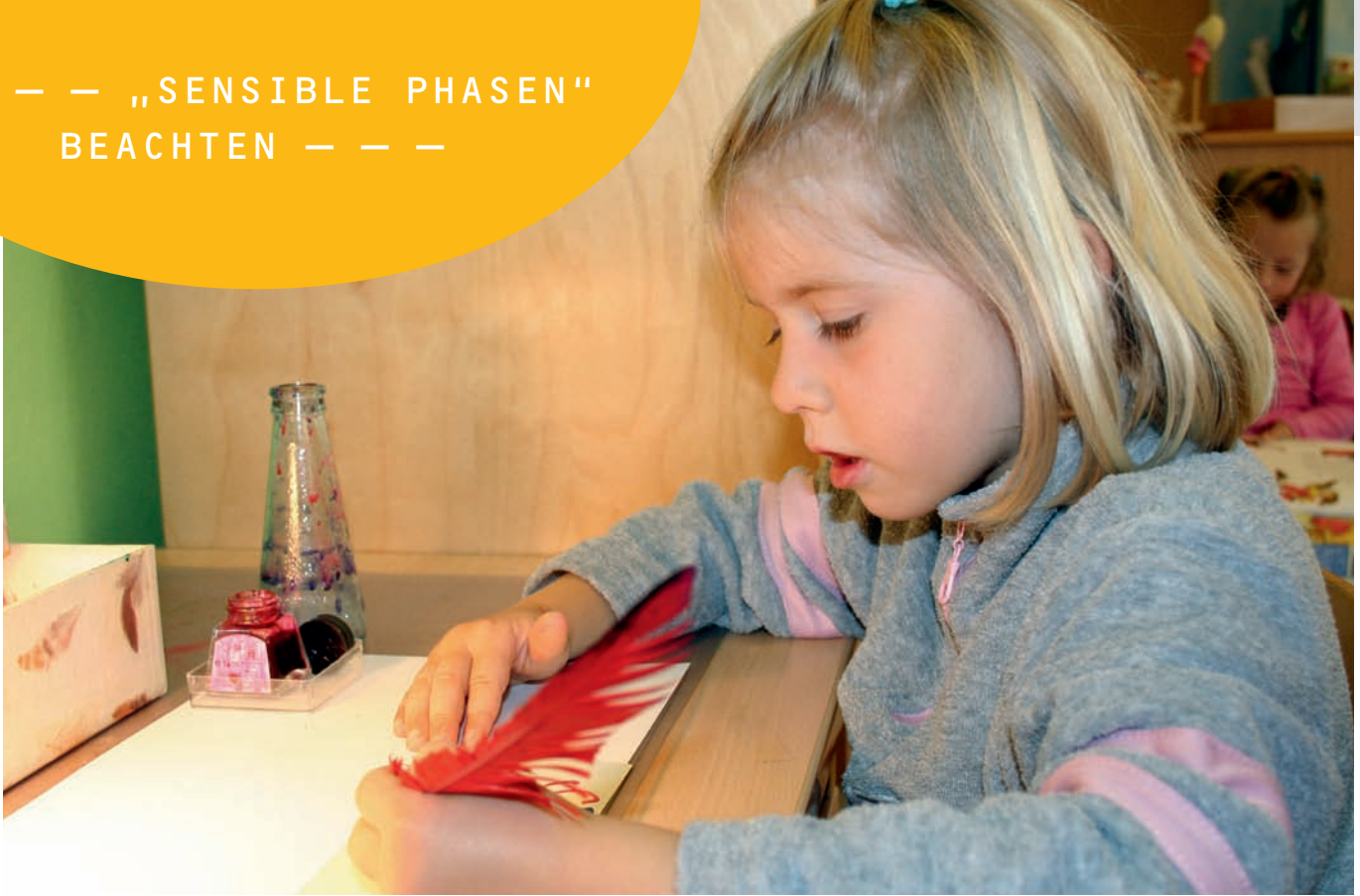
1 | Schreiben wie die Menschen früher – zum Beispiel mit einer Feder