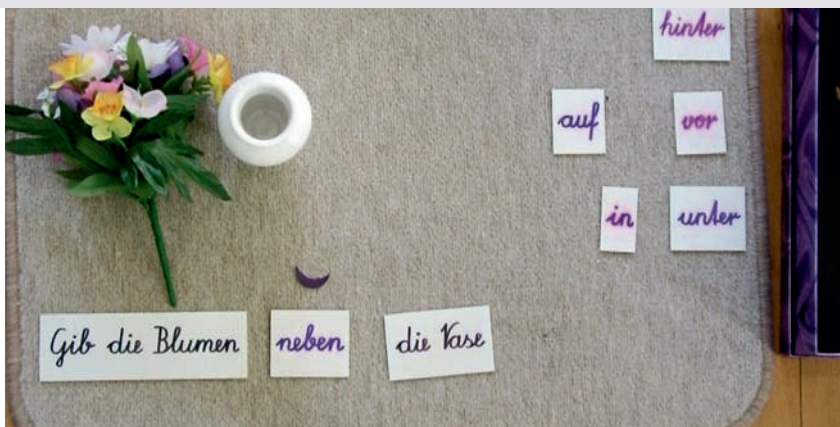
5 | „in“, „auf“, „neben“ – wohin kommen denn nun die Blumen? Ein konkreter Auftrag macht die Aufgabe der Präposition erlebbar

Kinder, die sich für die Einteilung des Tierreichs interessieren oder für die unterschiedlichen Land- und Wasserformen oder für die Teile der Pflanze und deren Funktionen, finden Definitionsmaterial vor, mit dessen Hilfe sie sich die genaue Bezeichnung und deren Definition erarbeiten können.